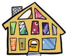
10 principes van MARA de Model Architectuur Rijks Archiefinstellingen

De Model Architectuur voor Rijks Archiefinstellingen heeft 'het huis van MARA' gepubliceerd, een visualisatie en uitleg van de 10 belangrijkste principes binnen de MARA. De meeste principes zijn specifiek voor het eigen domein: keuzes die gemaakt zijn om recht te doen aan de eigenheid van de deelnemende regioarchieven, terwijl je de burger ook de rijkdom biedt van verbonden collecties. Tegelijk herken je veel thema's die domein-overstijgend zijn, zoals het gebruik van generieke bouwblokken en het goed identificeren en omgaan met data en metadata.