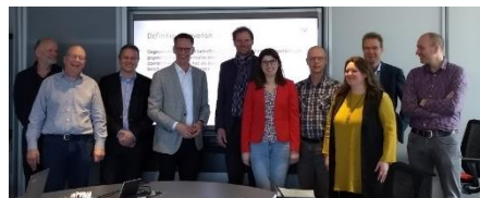
2 Expertgroep na vaststellen werkdefinitie gegevensmanagement

De NORA Expertgroep Gegevensmanagement is nu een klein jaar bezig om het onderwerp op de kaart te zetten als thema en de gezamenlijke kennis te ontsluiten voor de hele publieke sector. Na het uitwisselen van ervaringen en zienswijzen vanuit verschillende organisaties kwamen we op een gedragen werkdefinitie van het begrip. Nu is het zaak om onze kennis en tips te delen in een logisch en begrijpelijk geheel. De eerste teksten over rollen en inrichting van de verschillende producten van gegevensmanagement staan inmiddels in de wiki, met als voorblad de pagina Gegevensmanagement . De teksten zijn nog niet definitief, dus feedback is welkom.